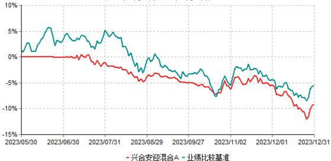
兴合安迎混合A累计净值增长率与业绩比较基准收益率历史走势对比图 (2023年05月30日-2023年12月31日)

注：1、本基金建仓期为基金合同生效日起的6个月。截至建仓期结束，本基金各项资产配置比例符合基金合同及招募说明书有关投资比例的约定。